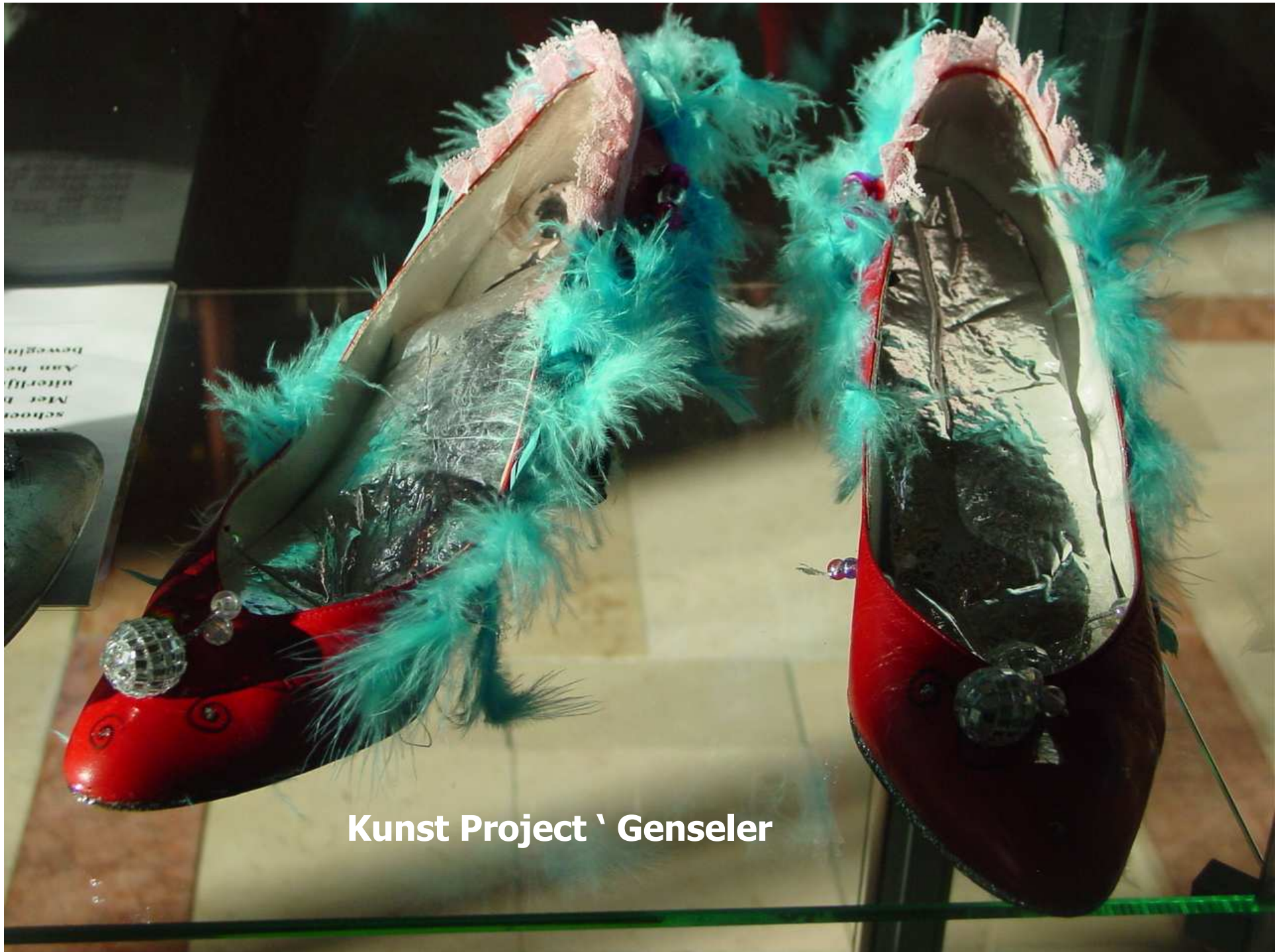
Kunst Project ` Genseler